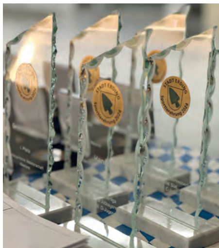
Darum geht's: Die Auszeichnungen der Stadt für ihre besten Sportler.