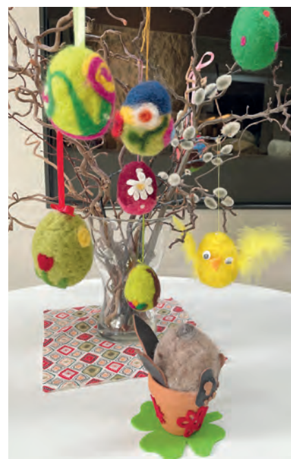
Die Kinder basteln Ostereier und Blumentöpfe.

Das Museum Erding in der Prielmayrstraße 1 bietet am Samstag, 12. April, von 14 bis 16.30 Uhr einen Osterbastelworkshop für Grundschulkindern an. Aus bunter Schafwolle und einer Filznadel entstehen Ostereier für den Osterstrauß und Tischdekorationen in Form eines versteckten Häschens im Blumentopf. Bei einem Rundgang durch die Lodererabteilung erfahren die Kinder außerdem wie kraft- und zeitaufwendig vor 500 Jahren in Erding wetterfeste und langlebige Stoffe für Kleidung hergestellt wurden. Die Teilnehmer sehen die historischen Werkzeuge und können das Kardieren der Wolle selbst ausprobieren. Die Kosten betragen pro Kind (inklusive Material) 13 Euro. Die Gebühr muss vorab im Museum bezahlt werden. Kleidung sollte schmutzig werden dürfen. Anmeldungen sind telefonisch unter 08122/408-158 oder per Mail unter museum@erding.de möglich. Die Teilnehmerzahl ist auf 15 Kinder beschränkt. Kurzentschlossene sind jederzeit willkommen, soweit noch Plätze frei sind.