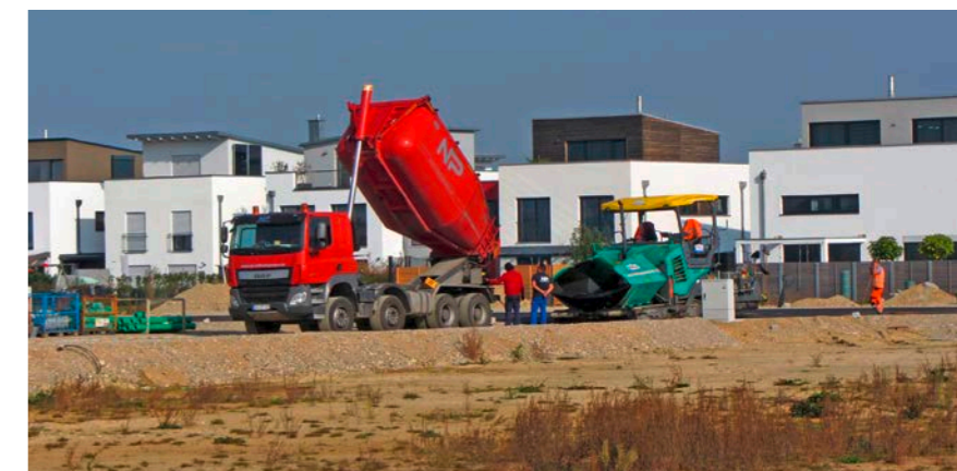
Die Entwicklung des Immobilienmarkts ist eines der großen Themen Erdings. Der Mietspiegel sorgt für Überblick im Mietsektor.

In diesen Tagen erhalten alle Haushalte im Stadtgebiet Post von der Stadt Erding: In dem Schreiben wendet sich Oberbürgermeister Max Gotz an die Mieter von Wohnraum und bittet sie, sich an der Befragung für den neuen Mietspiegel zu beteiligen. Bei einem Mietspiegel handelt es sich nach dem Bürgerlichen Gesetzbuch (BGB) um eine Übersicht über die ortsübliche Vergleichsmiete. Dieser Wert wird aus den Entgelten gebildet, die für Wohnungen vergleichbarer Art, Größe, Ausstattung, Beschaffenheit und Lage in den vergangenen vier Jahren vereinbart waren. Ziel ist, die Festsetzung von Mieten zwischen