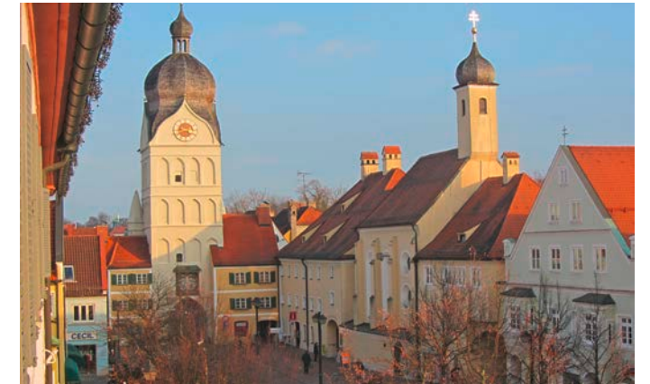
Der größte der drei Stadtteile ist nach wie vor Altenerding, größter Ortsteil bleibt Erding.