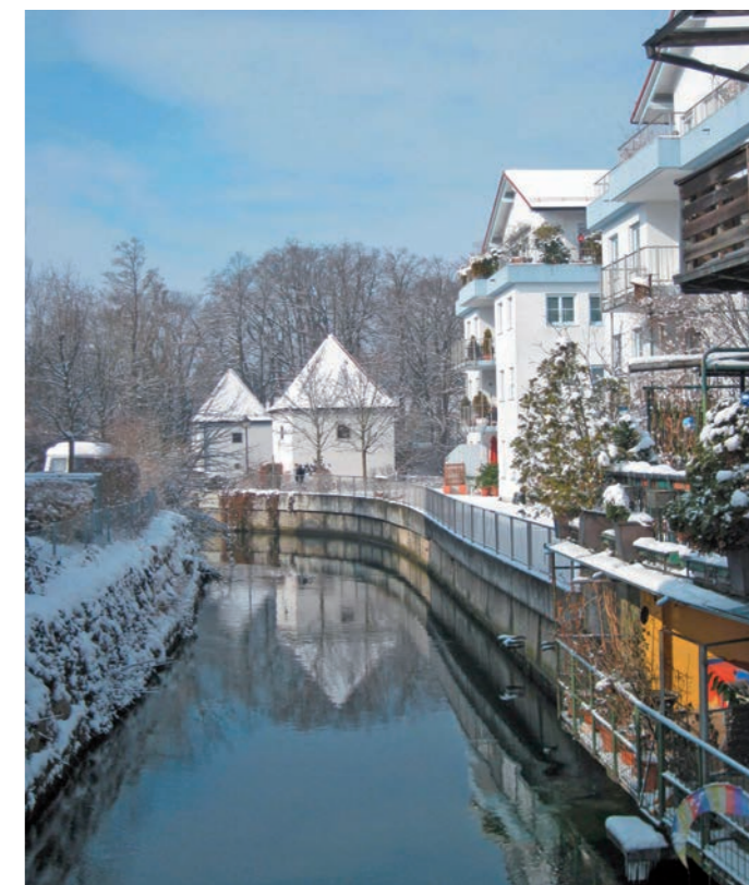
Erding und seine Stadtteile wachsen, im vergangenen Jahr aber gering.

einem hohen Niveau. Die 388 Geburten in 2016 hatten den höchsten Wert der vergangenen fünf Jahre dargestellt. Das Bevölkerungswachstum der Großen Kreisstadt liegt nicht allein im Zuzug begründet, da 2018 laut der Statistik 321 Personen starben (2017: 335) und damit weniger als geboren wurden. Die Zahl der Wegzüge fiel mit 2391 niedriger aus als 2017 (2497). Auch bei den Umzügen innerhalb des