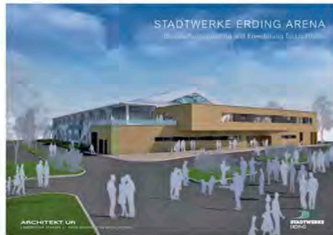
Visualisierung der Eissporthalle und des neuen Anbaus von ARCHITEKT.UR in Erding.

Ende Oktober beginnen die Arbeiten für den neuen Eismeisterbereich im östlichen Teil der Eishalle. Der Kassen-, Toiletten-, Umkleide- und Eismeisterbereich wird voraussichtlich im April 2019 abgerissen und durch einen zweigeschossigen Neubau ersetzt. (Visualisierung siehe Bild unten).