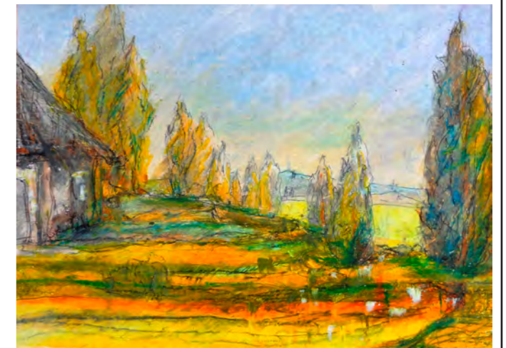
... ist im Museum Franz Xaver Stahl zum ersten Mal die Sonderausstellung mit Werken von Wilfried Lang zu sehen. Die „Idyllische Landschaft“ stammt aus 2012.

geheimnisvoll verpackten und nur teilweise bemalten Leinwänden.