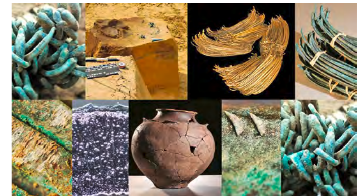
796 Teile sauber zu Zehnerbündeln geschnürt – der Spangenbarrenhort von Oberding.

Der Spangenbarrenhort von Oberding aus dem Museum Erding befindet sich derzeit als Leihgabe in Berlin und ist bis 6. Januar in der Bundesausstellung „Bewegte Zeiten. Archäologie in Deutschland“ im Martin-Gropius-Bau zu sehen. Die Schau zeigt gesamtdeutsche Neu-Entdeckungen der vergangenen 20 Jahre. Der 2014 entdeckte Fund gilt als archäologische Sensation: 796 Kupferbarren mit einem Gesamtgewicht von über 80 Kilogramm aus der Frühen Bronzezeit (1700 v. Chr.) kamen im Zuge einer Ausgrabung für ein Zweifamilienhaus in Oberding zu Tage. Nach dem Erwerb durch die Stadt Erding wurde Europas umfangreichster Spangenbarrenhort in einem breit angelegten Forschungsprojekt detailliert untersucht. Die Barren aus Oberding gelten als einer der frühesten Nachweise für die Anwendung des Dezimalsystems im komplexen Wirtschaftssystem der Frühbronzezeit Mitteleuropas, da sie sauber zu Zehnerbündeln geschnürt am Rand einer Abfallgrube deponiert und aus heute unbekannten Gründen nicht mehr gehoben wurden.