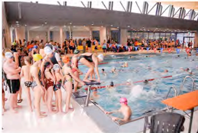
Bild oben: Sorgt für Entlastung im Hallenbad. Das Ende 2012 eröffnete Lehrschwimmbecken wird schwerpunktmäßig von Schulen und Vereinen genutzt.

Seit Donnerstag, den 15. September 2016 ist das Freibad geschlossen. Die Stadtwerke Erding bedanken sich bei heuer über 91.000 Badegästen, die den tollen Sommer zum Sonnenbaden in unserem Freibad in Erding verbrachten. Das Hallenbad Erding ist nach zweiwöchiger Revisionszeit seit Dienstag, den 27. September 2016 wieder zu den regulären Öffnungszeiten geöffnet.