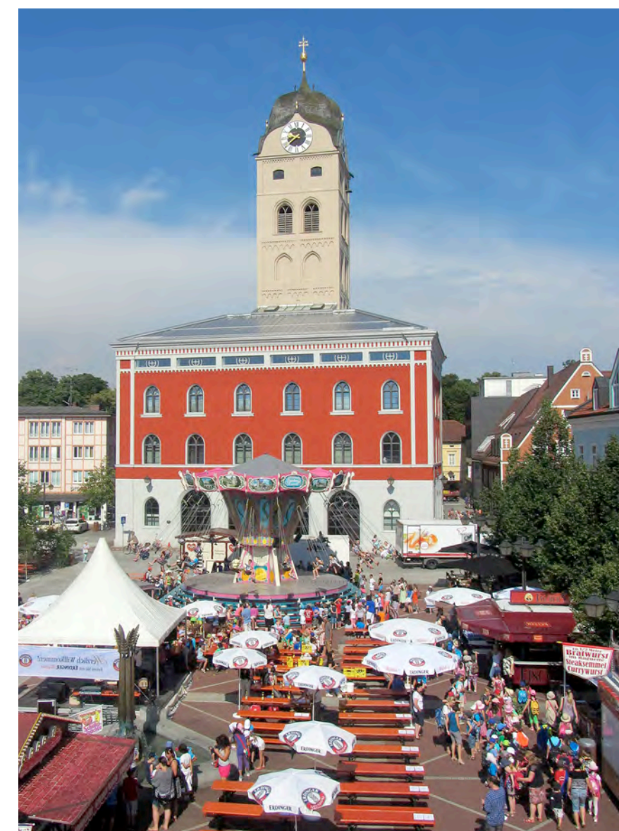
In diesem Jahr ist die Montgolfiere, nicht das Kettenkarussell, während des Altstadtfestes auf dem Schrankenplatz zu Gast.