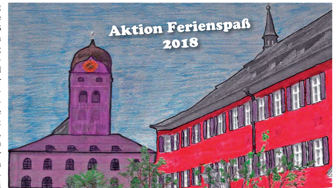
Bei den vielen Ausflügen, Kursen und Aktionen, die der „Ferienspaß“ bietet, wird niemandem langweilig.

Langeweile hat in Erding in den Sommerferien keine Chance: Der „Ferienspaß 2018“, veranstaltet vom Kulturamt der Stadt Erding in Zusammenarbeit mit verschiedenen Vereinen und Institutionen, umfasst heuer 51 Veranstaltungen - und damit jede Menge Gelegenheiten für abwechslungsreiche Sommerferien. Beginn ist bereits am ersten Ferientag, am Samstag, 28. Juli, wenn die Tennisabteilung der SpVgg Altenerding einen Talentino-Tennis-Schnuppertag organisiert. Zwei Tage später, am Montag, 30. Juli, starten die Kin-