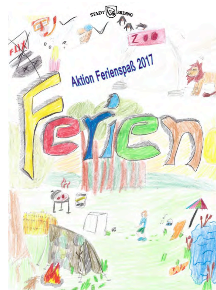
Das Anmeldeverfahren ist heuer neu, aber die Veranstaltungen der „Ferienspaß“-Aktion sind so interessant und vielfältig wie immer.

Wie geht es weiter? Nach der Anmeldephase und der Verlosung der Plätze am Freitag, 7. Juli, werden alle Eltern benachrichtigt, an welchen Veranstaltungen ihre Kinder teilnehmen können. Die Stadt bittet dabei zu berücksichtigen, dass verknüpfte Anmeldungen die Teilnahme erschweren. Werden zum Beispiel drei Geschwister für eine Veranstaltung angemeldet, obwohl nur noch zwei Plätze frei sind, weist das System alle drei Anmeldungen zurück. Binnen einer Frist müssen dann die Teilnahmegebühren bar in der Stadtkasse gezahlt werden, weil die Plätze sonst an andere Interessierte vergeben werden. Der „Ferienspaß“ umfasst in diesem Jahr 42 Veranstaltungen, unter anderem einen Tennis-Schnuppertag, eine Fahrt zum Bayernpark oder eine Wanderung in die Wolfsschlucht sowie zahlreiche Kreativ-Angebote und mehrtägige Ausflüge. Weitere Fragen zur