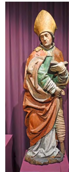
Der „Erdinger Erasmus“ kommt ursprünglich wohl aus Finsing.

Das Museum Erding beteiligt sich zur Zeit mit einer prominenten Leihgabe an einer großen Ausstellung in München: Das Bayerische Nationalmuseum zeigt den „Erdinger Erasmus“ in der Schau „Bewegte Zeiten – der