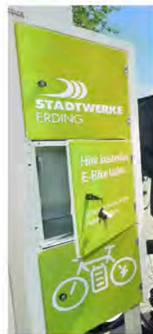
s.o. E-Bike Ladestation Schwimmbad Erding, Am Stadion.

Als E-Bike Besitzer können Sie ihre Akkus an den Ladestationen am Schwimmbad außerdem kostenlos aufladen.