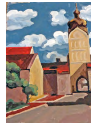
Der Schöne Turm, Ölgemälde von Peter Hauber.

Im Museum Franz Xaver Stahl in der Landshuter Straße 31 eröffnet am Sonntag, 20. Mai, die Sonderausstellung „Mit Pinsel und Palette – Unser Schöner Turm“. Als Beitrag des Museums zur großen Ausstellung „Unser Schöner Turm“ im Museum Erding sind im Stahl-Museum Gemälde ausgestellt, die das Wahrzeichen Erdings zeigen. Verschiedene Künstler haben das einstige Stadttor als Motiv entdeckt. Akademisch geschulte Maler, begabte Hobbykünstler, Grafiker und Besucher der Stadt Erding hielten den Turm in Zeichnungen, schnellen Skizzen, Aquarellen und Gemälden fest: oft realistisch genau, auch impressionistisch in der Auffassung oder ganz bunt, detailgetreu oder in sehr freier Interpretation, akademisch gekonnt oder verfremdet dargestellt. Geöffnet ist von 14 bis 17 Uhr, der Eintritt frei. Anmeldungen für private Führungen an allen anderen Tagen sind unter der Telefon-Nummer 08122/408-160 möglich.