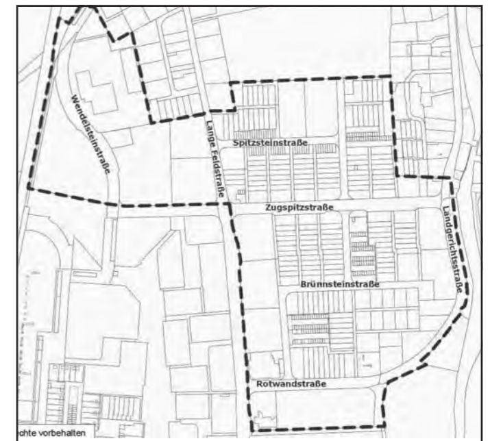
Das ist der Planungsgriff des Bebauungsplans Nr. 62.11.