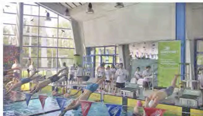
Redaktion SWE/EGE/ÜE/WVE: Christopher Ruthner (verantw.)

Auch dieses Jahr waren die Teilnehmer wieder rundum zufrieden. Die Gäste freuten sich bei strahlendem Sonnenschein besonders über die Möglichkeit, auch nach draußen gehen zu können. Hierfür hatten die Kollegen am Vorabend extra noch eine kleine Liegefläche geschaffen, sodass man sich auch hier abseits des Wettkampfgeschehens entspannen konnte. Richtig laut wurde es schließlich auch bei den zahlreichen Staffeln, die an beiden Tagen stattfanden. Die erfolgreiche Veranstaltung soll auch eine erneute Fortsetzung finden: aus terminlichen Gründen soll noch in diesem Jahr im Herbst die dritte Auflage des Stadtwerke Erding Cups ausgerichtet werden.