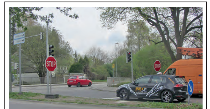
Die Kreuzung Anton-Bruckner-Straße und Am Gries weist ein hohes Verkehrsaufkommen auf; die neue Ampel soll die Situation entzerren.