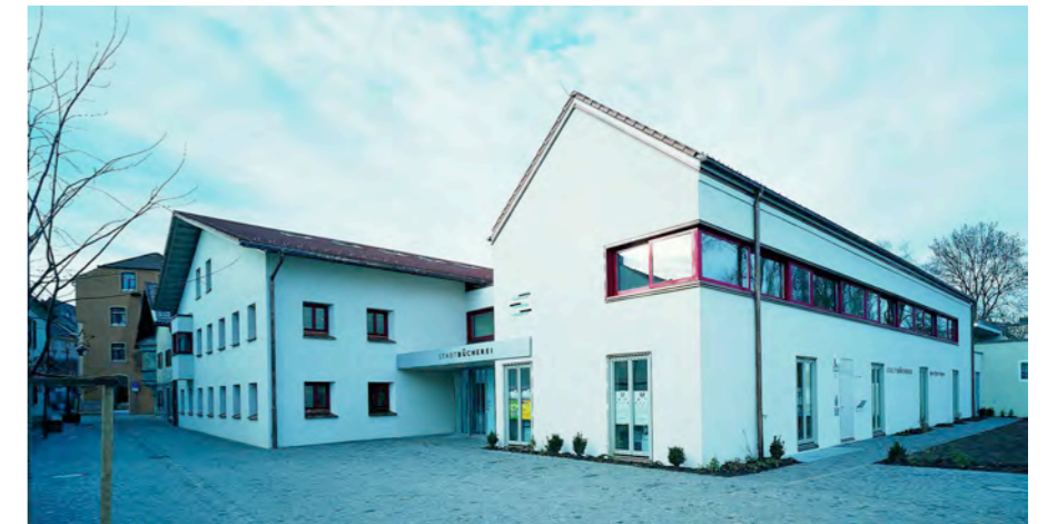
Die Stadtbücherei zählt zu den wichtigsten kulturellen Institutionen der Stadt.

Den Betrieb im neuen Domizil nahm die Stadtbücherei jedoch erst am 1. Dezember 1984 auf: Sie war in die neu erbaute Stadthalle integriert worden und belegte Räume im Erd- und ersten Obergeschoss. Bestand und Nutzer nehmen weiter zu, der technische Fortschritt geht weiter. So führte die Stadtbücherei 1996 als eine der ersten eine EDV-gestützte Verbuchung ein. Im Lauf der Jahre ent-