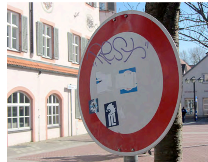
Kein Lausbubenstreich, sondern echtes Ärgernis: Beklebte Verkehrsschilder.

In letzter Zeit werden im Stadtgebiet Erding Verkehrszeichen und Verkehrseinrichtungen vermehrt mit Aufklebern versehen. Dies stellt ein erhebliches Ärgernis und Sicherheitsrisiko dar, da nicht nur die Sichtbarkeit für Verkehrsteilnehmer beeinträchtigt wird, sondern zudem zeit- und kostenintensive Reinigungsarbeiten durch den städtischen Bauhof notwendig sind. Zum Teil lassen sich die Aufkleber nur mit speziellen Reinigungsmitteln entfernen, die unter Umständen die reflektierende Oberfläche so beschädigen, dass das Verkehrszeichen doch komplett erneuert werden muss. In diesem Fall liegt der Straftatbestand der Sachbeschädigung nach § 303 des Strafgesetzbuches (StGB) vor. Die Stadt Erding bittet daher um Hinweise. Festgestellte Verstöße werden zur Anzeige gebracht.