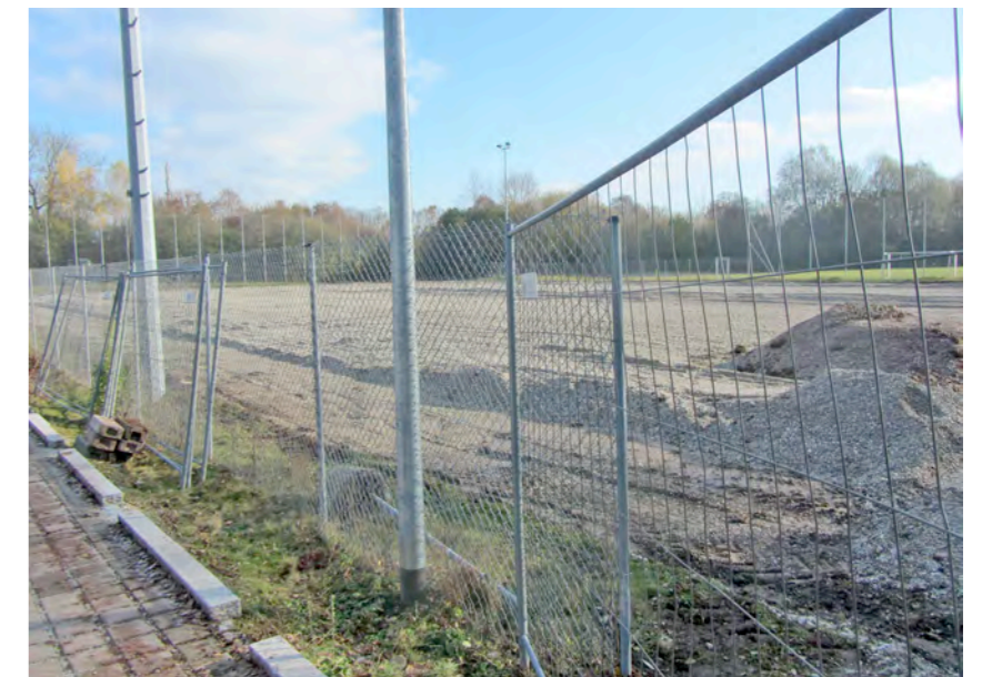
Einen hohen Stellenwert genießt seit jeher der Sport in der Stadt; Sportstätten wie hier in Altenerding werden saniert und dem Bedarf angepasst. Das ist eine von vielen Aufgaben für das Personal der Stadtverwaltung (siehe Statistik).

Die Statistik gibt unter anderem einen Überblick über • die Sportstätten im Stadtgebiet und die verliehenen Medaillen bei der jährlichen Sportlerehrung und macht so deutlich, welche Bedeutung Sport in jeder Facette im Stadtgebiet hat • die Ganztagsbetreuung an den Grund- und Mittelschulen und zeigt, welche unterschiedlichen Modelle es gibt • die offene Jugendarbeit mit den beiden Einrichtungen in der Dorfener Straße und Pretzener Weg • das Konzept und die Situation des Museums Franz Xaver Stahl, das den Nachlass des bedeutenden Erdinger Tiermalers beherbergt • die Mitglieder und Aktivenzahl der drei Feuerwehren Erding, Altenerding und Langengeisling und damit von Organisationen, die für die Sicherheit aller Bürgerinnen und Bürger von elementarer Bedeutung sind • den Personalstand der Stadtverwaltung und in welchen Dienststellen wie viele Mitarbeiter eingesetzt werden