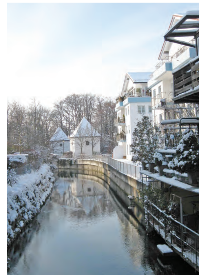
Erding und seine Stadtteile wachsen, im vergangenen Jahr aber sehr gering.

388 Geburten in 2016 hatten den höchsten Wert der vergangenen fünf Jahre dargestellt. Das Bevölkerungswachstum der Großen Kreisstadt liegt nicht allein im Zuzug begründet, da 2017 laut der Statistik 335 Personen starben (2016: 342) und damit weniger als geboren wurden. Die Zahl der Wegzüge fiel mit 2497 nur minimal höher aus als 2016 (2483). Bei den Umzügen innerhalb des Stadtgebiets ergab sich ein leichter Rückgang. Wechselten 2016 insgesamt 1435 Menschen in Erding ihren Wohnsitz, taten dies im vergangenen Jahr 1396.