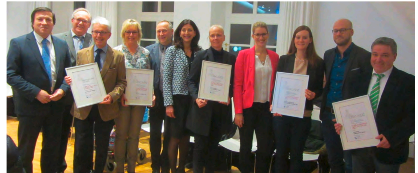
Oberbürgermeister Max Gotz zeichnete vier Erdinger Unternehmen und den Rotary Club für ihr großes Engagement bei der Ausbildung junger Menschen aus.

IMPRESSUM 33. Jahrgang Erscheinungsweise: Donnerstags, 14tägig Herausgeber und verantwortlich für den Inhalt: Stadtverwaltung Erding, Telefon 0 81 22 / 4 08 - 2 05 Herstellung und Vertrieb: SEMPT-KURIER GmbH, Erding, Telefon 0 81 22 / 97 94 - 0 Auflage: 14.000 Exemplare