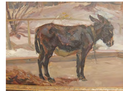
Ein Top-Model der 1920er Jahre.