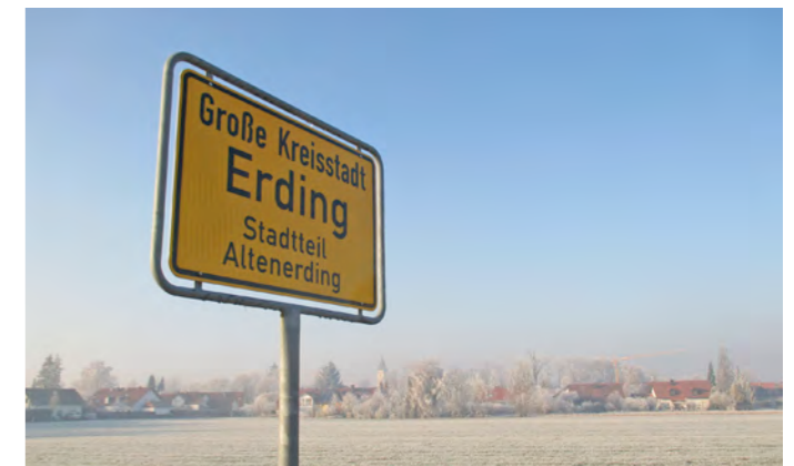
Erding wächst weiter, doch der Anstieg hat sich verringert.