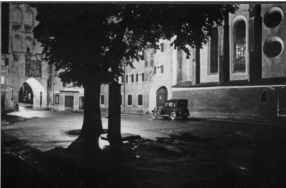
Das Oktober-Motiv des Kalenders ist eine Aufnahme der Landshuter Straße aus den 1920er Jahren und könnte die Kulisse eines Gangsterfilms sein: Links der Schöne Turm, rechts die Heiliggeist-Kirche.