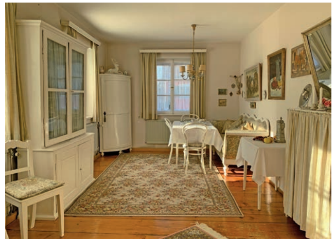
Welches Leben wurde hinter der original erhaltenen Biedermeier-Einrichtung geführt?

Das Museum Franz Xaver Stahl bietet im Mai in Zusammenarbeit mit der Volksspielgruppe Altenerding besondere Erlebnisführungen durch das Biedermeierhaus in der Landshuter Straße 31 an. Die neu konzipierte Führung blickt tief hinter die Kulissen des nach außen verschlossen lebenden Tiermalers Franz Xaver Stahl (1901 bis 1977). Die Schauspieler der