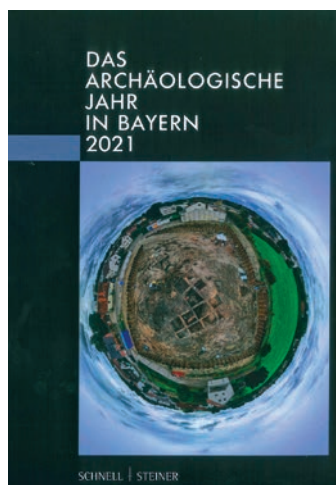
„Das archäologische Jahr in Bayern 2021“ ist im Museum Erding (geöffnet Dienstag bis Sonntag von 13 bis 17 Uhr) zum Preis von 25 Euro erhältlich.